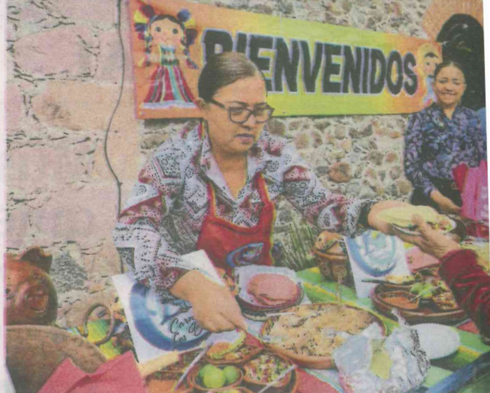
La delegación Santa Rosa Jáuregui espera recibir la visita de más de

El Universal, El Gran Diario de México, es una publicación de El Universal, Compañía Periodística Nacional, S.A. de C.V. Miembro del Instituto Verificador de Medios (IVM). Miembro de la World Association of Newspapers (WAN). Miembro del Grupo de Diarios América (GDA). Miembro de la Sociedad Interamericana de Prensa (SIP). Miembro de la American Society of Newspaper Editors (ASNE).